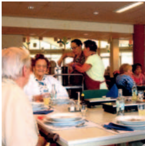
• Gezamenlijk eten in De Hofstede

Naast de vele activiteiten worden er ook lezingen, feestmiddagen theater- en muzikale optredens aangeboden die veelal druk bezocht worden.