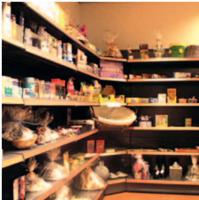
• Winkeltje (SIG) in wijksteunpunt De Delta

Grootste verandering die speelt is dat er mogelijkheden zullen worden geboden om, naast de activiteiten die u gewend bent in het wijksteunpunt, ook deel te nemen aan andere activiteiten die in het Verpleeghuis worden georganiseerd. Denk bijvoorbeeld aan de